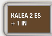
KALEA 2 ES + 1 IN