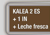
KALEA 2 ES + 1 IN + Leche fresca